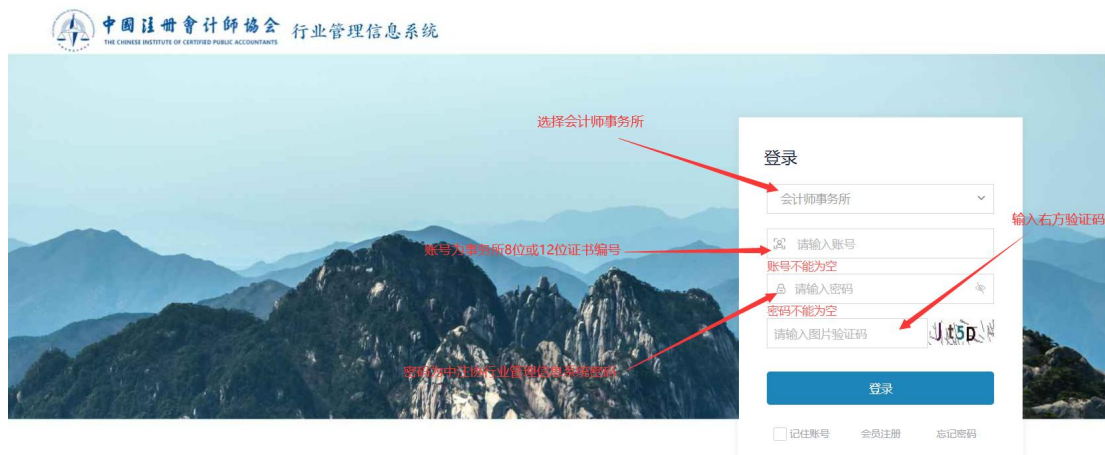
2.1-1 年检系统登录界面

在系统登录页面，用户类型选择“会计师事务所”，用户名为会计师事务所证书编号，输入密码，登录系统。